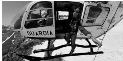
Los rescates se llevan a cabo en cualquier condición meteorológica, por adversa que esta sea. la opinión

Cuando llegaron los dos primeros aparatos el 21 de noviembre de 1984 a la recién creada Unidad de Helicópteros de la Guardia Civil de Canarias, a la que se le asignó el indicativo de radio Cuco, pocos eran los que se atreverían a vaticinar el abultado historial de este grupo. Más de 12.000 horas de vuelo, la mayoría sobre el mar, sin ningún accidente grave, 1.222 evacuaciones sanitarias, 985 rescates en montaña y costas y más de 3.000 inmigrantes salvados hablan por sí solos de la UH119.