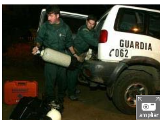
Seis excursionistas atrapados en una cueva de Tenerife

Una galería del siglo XIX que ya ha registrado más accidentes