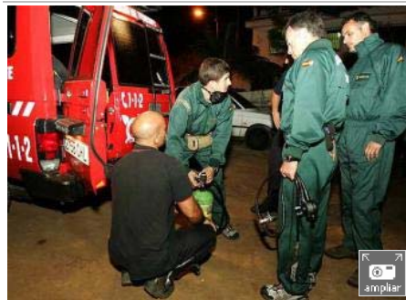
Miembros de la Guardia Civil, preparan sus equipos de buceo para iniciar el rescate de un grupo de excursionistas perdidos.

José empezó a notar que le faltaba el aire pero el guía, que no pudo acompañarles y que les daba las indicaciones por teléfono, les dijo que siguieran caminando hasta el final del túnel ignorando que estaban en la galería equivocada. Dos horas después de haberse desmayado, este ingeniero escuchó unas voces que le decían que volviera hacia atrás hasta que