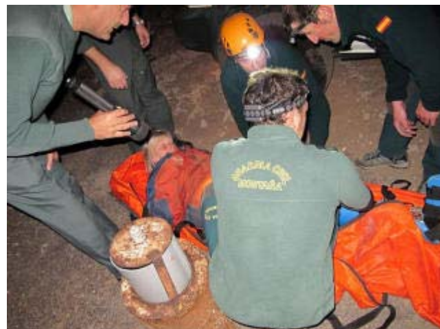
Componentes de los distintos equipos, fuerzas de Rural de San Sebastián de La Gomera, Servicio de Protección a la Naturaleza y Helicópteros en el momento de rescatar a la británica.

El servicio que se inició con una llamada al Cechoes 1-1-2 del Gobierno de Canarias a las 18:50 horas, en la que se le informaba de que dos personas tenían dificultades para salir por sus propios medios del barranco y una de ellas estaba herida. Desde la sala se les contestó que, debido a lo agreste del terreno, no disponían de personal para ese servicio ni terrestre ni aéreo, por lo que el marido de una ellas se fue caminando hasta un lugar con mayor accesibilidad para tratar de buscar ayuda.